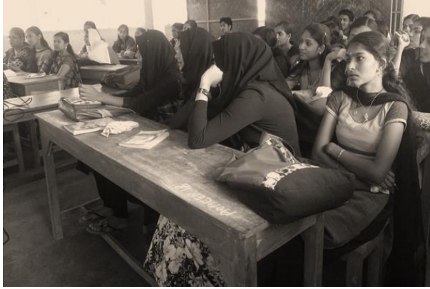
ക്ലാസ്സു് ഒരു ദൃശ്യം